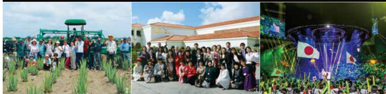
1 ジャパンラリー 2~3 アロエベラふるさとセミナー 4 グローバルラリーをはじめ多彩な特典プログラムをご用意。