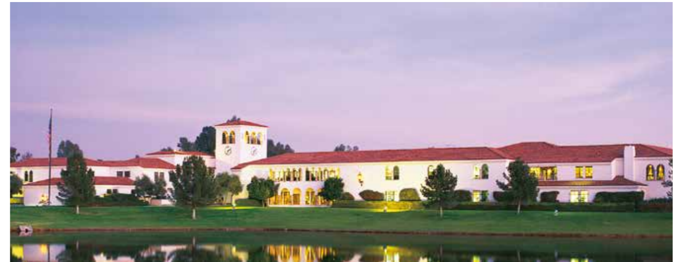
フォーエバーリビングプロダクツ インターナショナル本社 (アメリカ・アリゾナ州スコッツデール)

は、アメリカ上院栄養問題特別委員会が国民の栄養に関する報告、通称「マクガバンレポート」を発表し、健康と食生活についての関心が高まっていたときでもありました。フォーエバーでは健康に役立つ植物として昔から愛用されてきたアロエベラを選び、アロエベラジュースやその化粧品、さらにはミツバチ商品などを開発。ネットワークビジネスを展開し、やがて世界中に広まってきました。現在、世界で累計約1,000万人の方々の健康と繁栄と幸福をサポートしています。