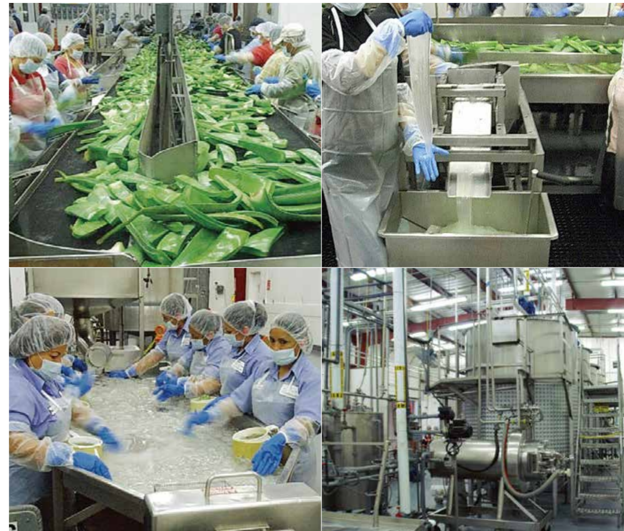
葉の周囲が切り落とされたアロエベラは外皮とジェルに分けられた後、外皮の破片などの異物が取り除かれます。ジェルをジュース状にし、安定化処理タンクへ。

太陽をたっぷり浴びてしっかりと育ったアロエベラはひとつひとつ丁寧に手作業で収穫。フォーエバー社の安定化処理工場へ運ばれます。