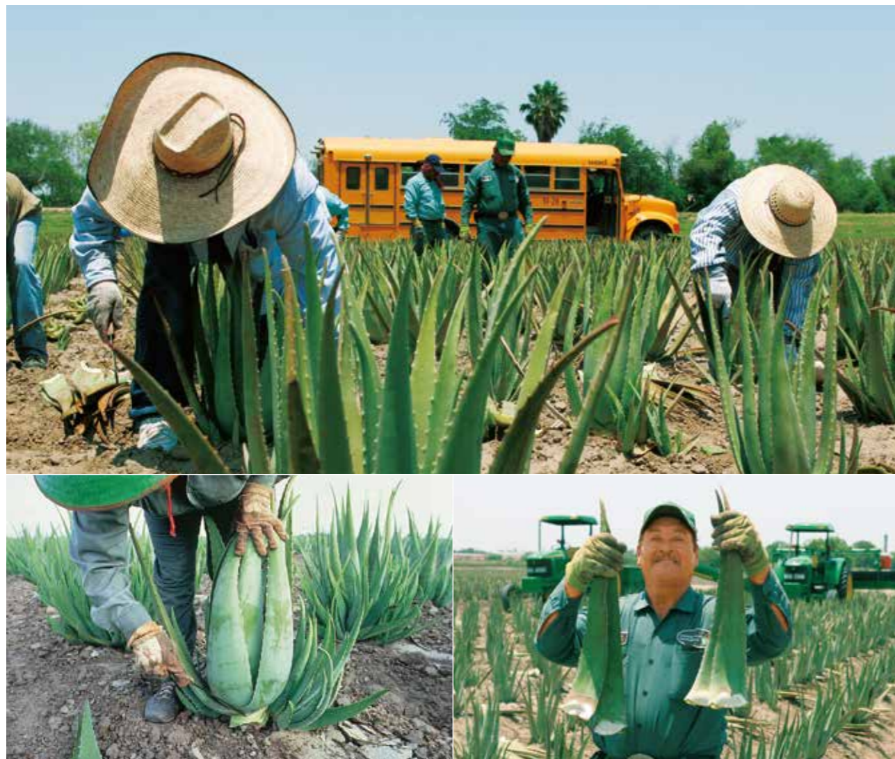
アロエベラ畑では苗を手作業で植え付けし、3年目から刈り取りをはじめます。外側の葉から2、3枚ずつ手作業で刈り取って行きます。

肥沃な大地で、太陽をたっぷり浴びて育ったアロエベラを手作業で収穫し、ジェルにします。