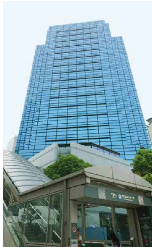
フォーエバーリビングプロダクツ ジャパン本社

フォーエバー社は日本に初めてアロエベラ ジュースを 紹介した、リーディングカンパニーです。