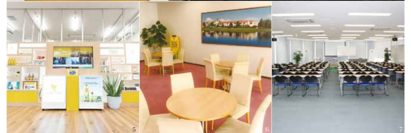
1~4グランドサロン大阪 5南関東営業所 6サロン九州 7さいたま営業所