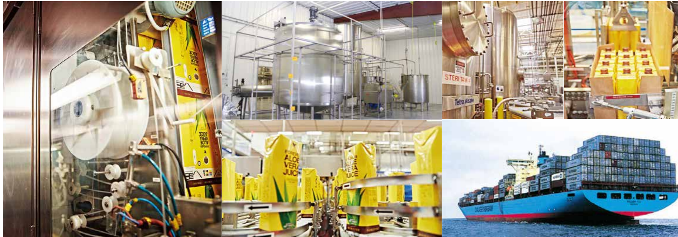
アロエベラ ジュースをテトラパックに充填。箱詰めして出荷。