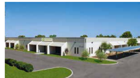
最新設備の工場、ニュートラス・ティカル。

フォーエバー社はこれまでも、これからも環境への配慮を忘れず、環境にやさしい企業であり続けたいと考えています。