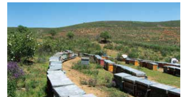
生命力あふれる植物とミツバチからの贈り物です。

2011年にアリゾナ州フェニックスに完成した栄養補助食品を製造している工場です。ビーポーレン、ビープロポリス、フォーエバーライト アミノウルトラ、ARGI+などを製造。製品の安全性と安定供給を図りながら、世界160カ国以上に出荷されます。