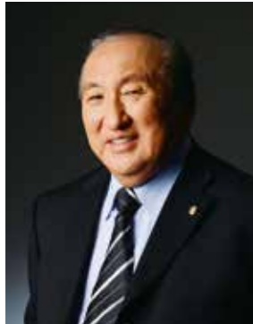
社長 兼 共同創業者